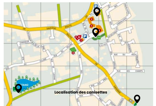
Localisation des canisettes

Un grand merci aux artistes de la section Décoration de l'association Wiwaces pour leur belle créativité.