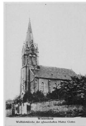
Wiversheim Wallfahrtskirche der schmerzhaften Mutter Gottes

Comme énoncé par François "Chercher c'est ouvrir une boîte de Pandore" . Nous vous invitons donc à consulter notre site internet dans les prochaines semaines, afin d'en apprendre davantage sur ces recherches absolument captivantes !